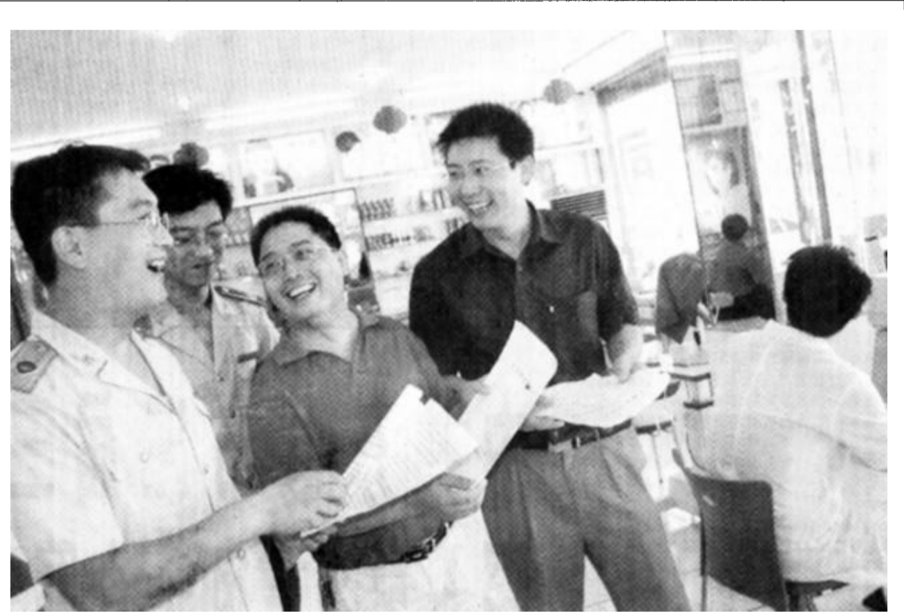
东营工商分局商河路工商所积极开展红盾帮扶活动,扶持辖区民营企业及个体户加快发展。日前,该所已确定帮扶对象20余家。图为工作人员正在向帮扶对象了解情况。

广饶讯 为进一步加快畜牧养殖业发展步伐,壮大龙头企业规模,提升农业产业化发展水平,广饶县积极推进畜牧养殖业的体制创新、机制创新和科技创新,依托山东凯银集团、东营华誉公司等畜牧龙头企业基地建设,突出抓好“两牛一羊一鸡”,走出了一条政府规划、政策引导、搞好服务、企业扶持、群众参与、企农双赢、市场运作的路子。