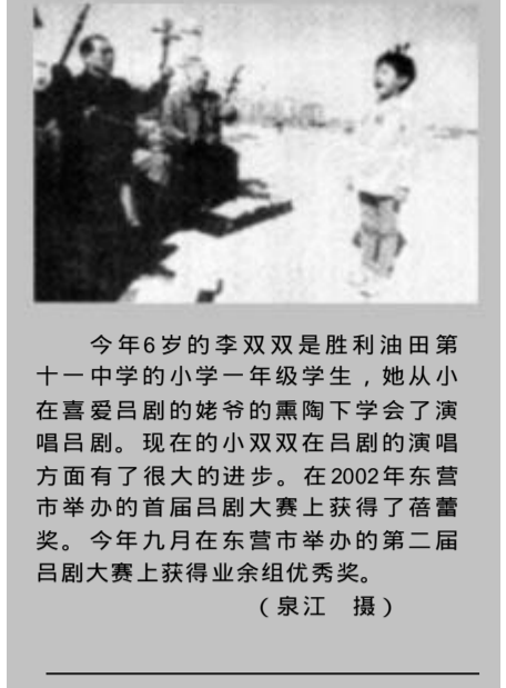
今年6岁的李双双是胜利油田第十一中学的小学一年级学生，她从小在喜爱吕剧的姥爷的熏陶下学会了演唱吕剧。现在的小双双在吕剧的演唱方面有了很大的进步。在2002年东营市举办的首届吕剧大赛上获得了蓓蕾奖。今年九月在东营市举办的第二届吕剧大赛上获得业余组优秀奖。

一方面指导帮助新承包户搞好生产管理，另一方面四处参观考查，经常到上级有关部门咨询，落实他在心中盘算已久的几个项目。今年7月1日，刘伟海承包了村东“上农下渔”项目的一个开发单元，投资40万元，在台田上建设永安镇第一家优质肉羊繁育基地，计划购进波尔山羊、杜波绵羊等优质品种，搞肉羊繁育。刘伟海认为，优质肉羊繁育是畜牧业发展的新趋势，效益较好，不仅能够引导群众转变观念从事名优新品种养殖，增加收入而且还能促进牧草种植业的发展，可谓一举多得，何乐而不为。 (保延 召伟 荣河)