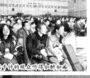
数以千计的观众听得如醉如痴

本报讯 胜利街道新兴社区的青年小王母亲因病去世了，工作又不顺心，情绪低落，导致做什么事情总是疑神疑鬼，明明锁好了，他又不停反复地锁。正在痛苦时，新兴社区的心理咨询志愿者走进了他家，帮他解开了心结，他的工作生活又恢复了正常。 为普及科学的生活方式和心理健康知识，增强居民自我调控能力，胜利街道在社区中广泛开展了居民心理健康教育活动。各社区加大宣传力度，普及科学的生活方式和健康的心理卫生知识。充分发挥社区市民文明学校和老人活动中心等阵地建设，使之成为社区居民心理健康教育的主阵地。有的社区还成立了心理咨询室、成长工作室，设置咨询电话、成长信箱和成长热线。各社区结合实际，方式灵活，利用节假日，与计划生育、卫生保健、社区服务、创“三无”社区等工作相结合，开展上门慰问、举办专题心理健康讲座等活动，切实将开展心理健康教育和办实事相结合。据悉，为推动这项活动的开展，街道文明办将于年底评选出心理健康教育示范社区。 (李冬梅 李波)